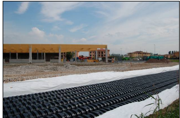
Fig. 2 - Contenimento dello scavo con tessuto-non-tessuto