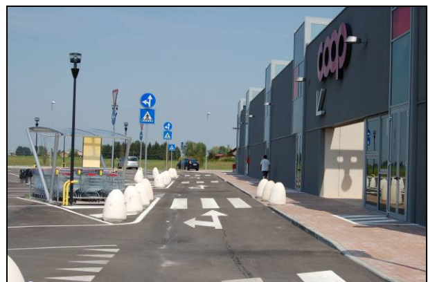
Fig. 4 - Parcheggio finito

Drening è stato posato formando un bacino di forma trapezoidale per seguire la geometria del parcheggio (confrontare fig. 1 con fig. 4) ed evitare la creazione di vuoti immediatamente a ridosso dell'ipermercato. È stato posato tessuto-non-tessuto su tutto il perimetro dello scavo per contenere la scarpata argillosa ed evitare l'intrusione di particelle fini all'interno del bacino.