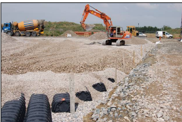
Fig. 3 - Ricoprimento con ghiaia