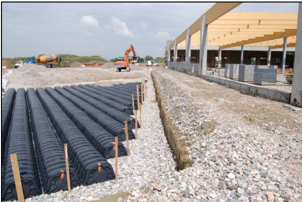
Fig. 1 - Posa delle camere Drening con geometria trapezoidale