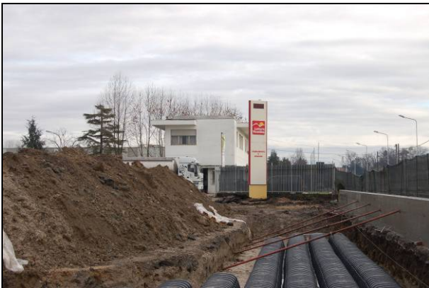
Fig. 1 - Posa delle camere Drening