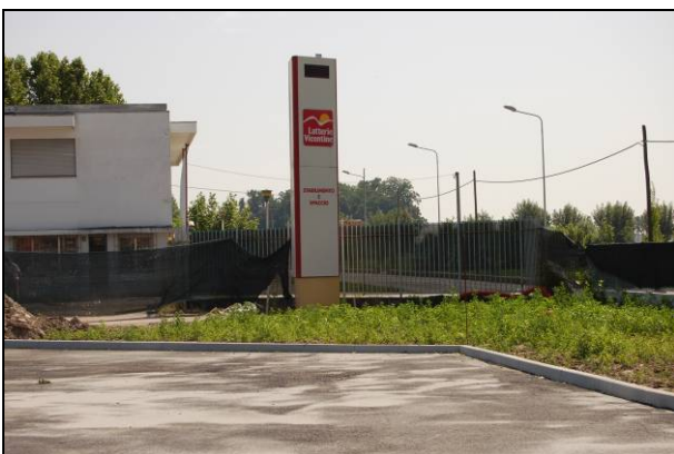
Fig. 3 – cantiere con aiuola finita