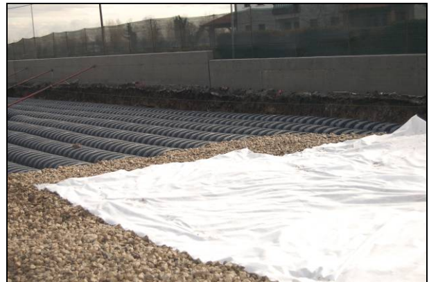
Fig. 2 – Posa del tessuto-non-tessuto filtrante