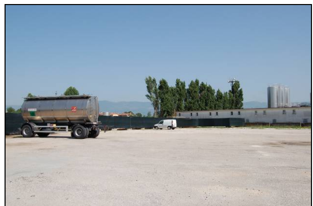
Fig. 3 – Vista dello stabilimento

I Consorzi di Bonifica Pedemontano Brenta, vista l'ampiezza dell'area impermeabilizzata nella realizzazione di quest'opera, ha vietato lo scarico nella rete di loro competenza e hanno obbligato il progettista a realizzare un bacino drenante per smaltire le acque meteoriche in loco.